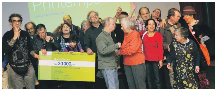
Die Gewinner des zweiten Preises und des Publikumpreises vom Wohnheim Feldegg