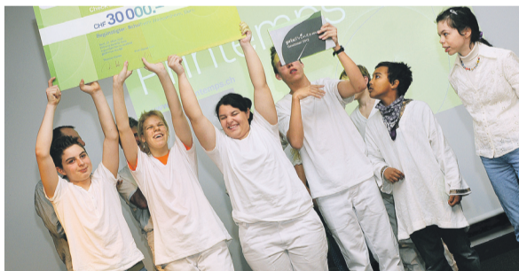
Die Gewinner des ersten Preises vom Weissenheim